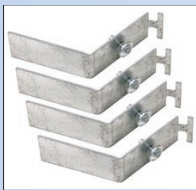
KG HOLDER - SET 4 pc (54000100)